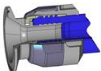
Raccord MSP® breveté (Montage sur place) MSP® patented fittings (Assembly on site) Disponible du Ø 13 au Ø 51 Available from Ø 13 to Ø 51